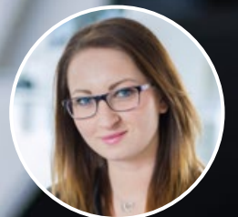
Louisa Marketing und Vertrieb